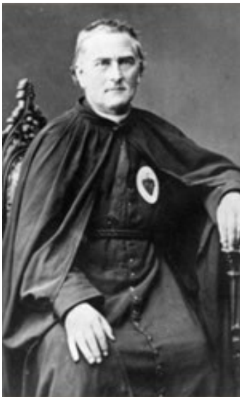
P. Jules Chevalier, fundador.

En 1.855 recibió la aprobación diocesana por el arzobispo de Bourges, y en marzo de 1.869 Pío X le concedió la aprobación pontificia. Las Constituciones religiosas fueron aprobadas definitivamente en el año 1.877.